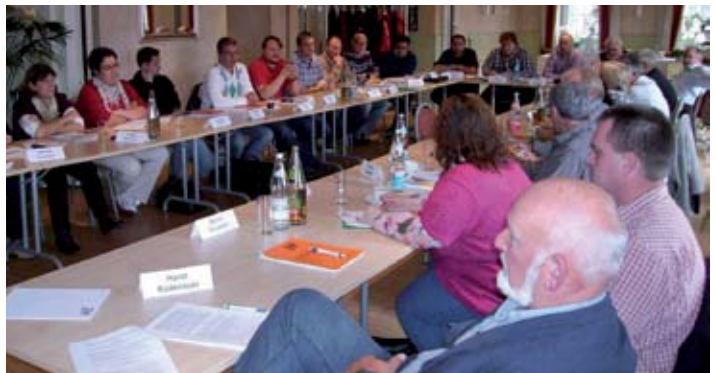
Personalrätekonferenz in Baden-Württemberg: Die DHV begrüßt das Vorhaben der grün-roten Landesregierung in Baden-Württemberg, die Rechte der Personalvertretungen zu stärken. Bei der jüngsten Personalrätekonferenz am 17. Oktober in Fürstentberg wurden die DHV-Vorstellungen zur Änderung des LPVG erarbeitet. Die Ergebnisse werden in einem Positionspapier zusammengefasst. Die DHV-Vorstellungen werden nun dem Innenministerium übermittelt, welches dazu in nächster Zeit mit allen Gewerkschaften Gespräche führen.

Der Hauptvorstand weist darauf hin, dass die Mitgliederbetreuung im Landesverband Hessen durch hauptberufliche Mitarbeiter auch weiterhin sichergestellt ist. Die Zuständigkeit richtet sich nach der Branchenzugehörigkeit der Mitglieder. Für Rückfragen steht die Hauptgeschäftsstelle zur Verfügung.