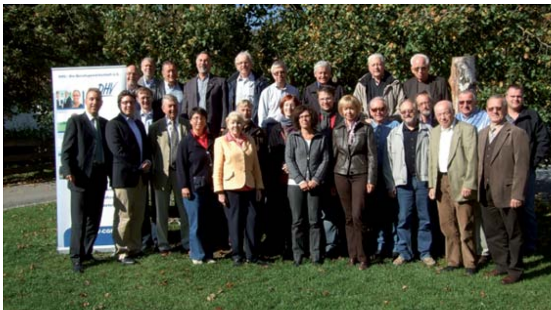
Teilnehmer der Herbsttagung 2011