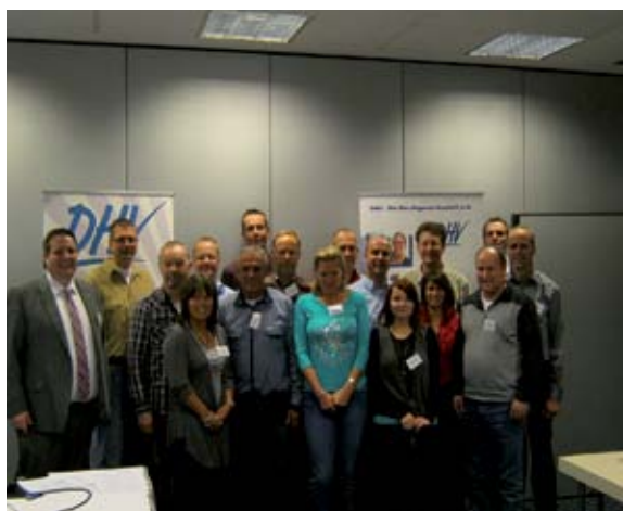
Die Teilnehmer der Regionalbetriebsgruppentagung in Nürnberg...